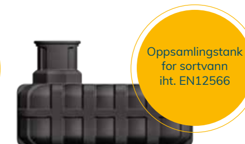
JETS® 3000 LITER