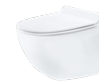
JADE BY JETS® Veggmodell, porselen Softsound™