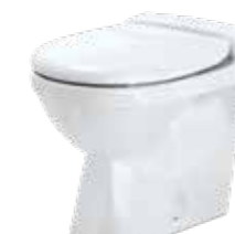
JETS® 50M Gulvmodell, porselen