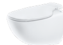
PEARL BY JETS® Veggmodell, porselen

Vi jobber hele tiden med å videreutvikle våre produkter, og vår nyeste toalettmodell, Jade by Jets®, er det mest lydsvake vakuumtoalettet på markedet.