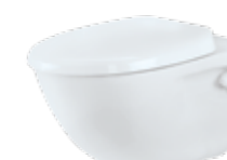
CHARM BY JETS® Veggmodell, porselen