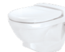
JETS® 59M Veggmodell, porselen