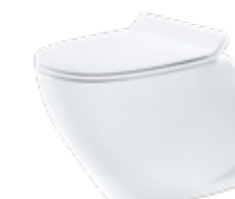
JADE BY JETS® Gulvmodell, porselen Softsound™