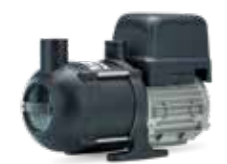
Jets® C200 Ultima 230V